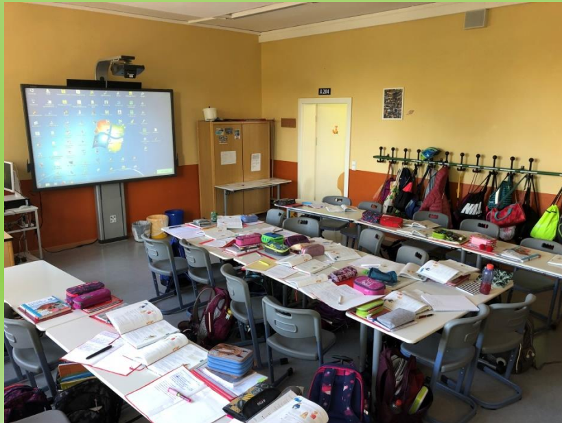
Klassenraum einer 2. Klasse